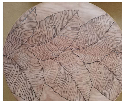
aufgenommenes Blattmotiv der Tapete